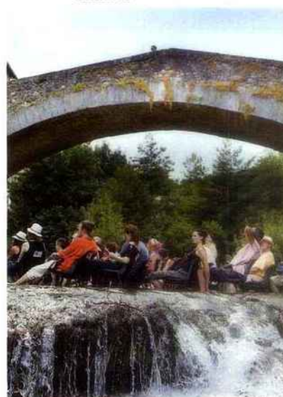
VOIX DE LA MÉDITERRANÉE

On aimerait y être : lecture « Les pieds dans l'eau » au festival Voix de la Méditerranée, à Lodève.