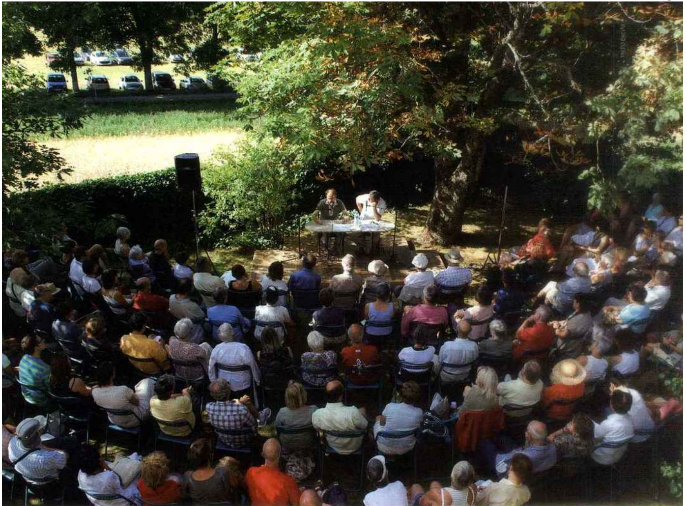
Lectures sous l'arbre au Chambon-sur-Lignon, avec Denis Podalydès.